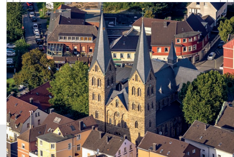
Pfarrkirche St. Johannes Baptist, Hagen-Boele

Katholische Kirchengemeinde St. Johannes Baptist, Hagen-Boele Hospitalstraße 13 58099 Hagen